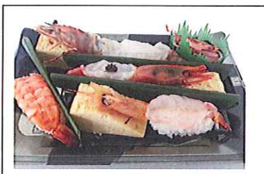
〈寿し常 粋魚〉 海老づくし5貫盛り 842円